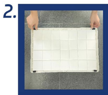
2. Otočte produkt a postupně nainstalujte 4 kolečka na své místo.