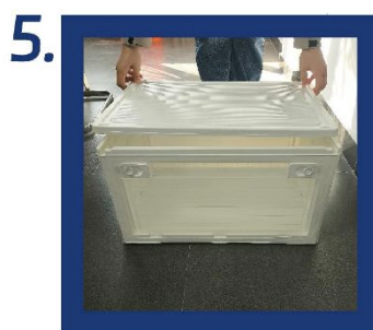
5. Nasadte horní kryt a ujistěte se, že je rovně.