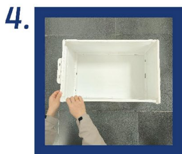
4. Stejným způsobem zarovnejte s příčkami a upevněte přední dveře.