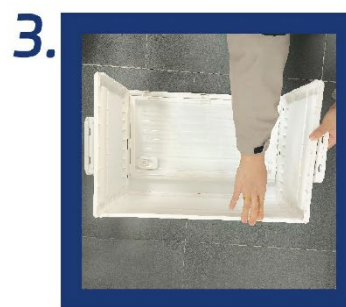
3. Po instalaci koleček otočte výrobek zpět do svislé polohy, otevřete boční dvířka tak, aby se zarovnal s příčkami zadního panelu, a zatlačením jej bezpečně upevněte.