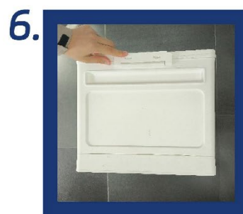
6. Pro dokončení montáže upevněte rukojeti na obou stranách.