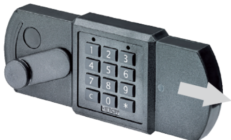
Obrázek 2.: Vstupní jednotka Primor RE