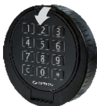
Obrázek 1.: Vstupní jednotka Primor RO