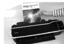
Obr. 5 Vyjměte dokončenou laminaci z výstupu na zadní straně zařízení