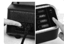
Obr. 1 Vypínačem uvedte zařízení do provozu a zmáčkněte ON/OFF