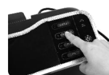
Obr. 2 Zvolte přísluš. operaci tlačítkem dokument/foto/cold