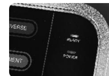
Obr. 3 Po rozsvícení tlačítka READY a zaznění tónu je zařízení připraveno