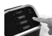
Obr. 7 Zařízení vypnete tlačítkem ON/OFF a přepnutím vypínače