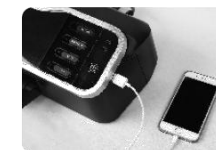
Obr. 8 Připojte Vaše zařízení pomocí USB adaptéru. Laminátor podporuje jak Android, tak iOS.